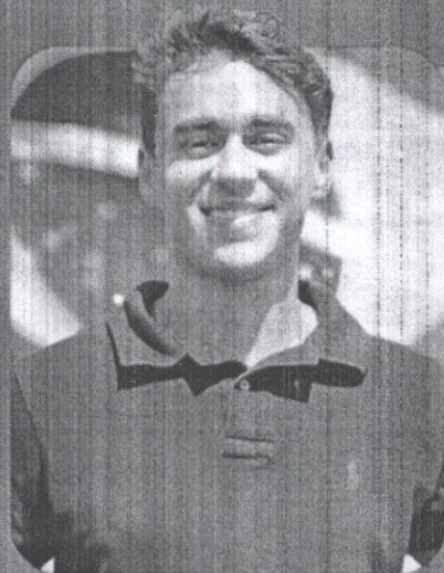
NIKOLAS FERREIRA DEPUTADO FEDERAL